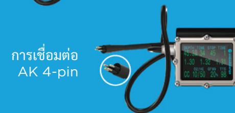
การเชื่อมต่อ AK 4-pin

*Shearwater ไม่ได้ให้การสนับสนุนทางเทคนิคใดๆ สำหรับ CCRs หรือคำแนะนำเกี่ยวกับการใช้งานของสินค้าร่วมกับ CCR