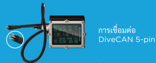
การเชื่อมต่อ DiveCAN 5-pin